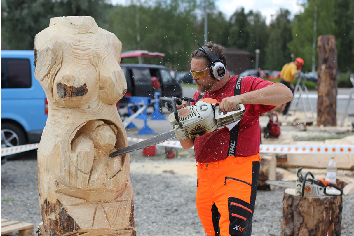
Moottorisahaveistoon liittyen järjestetään erilaisia tapahtumia ja kilpailuja.