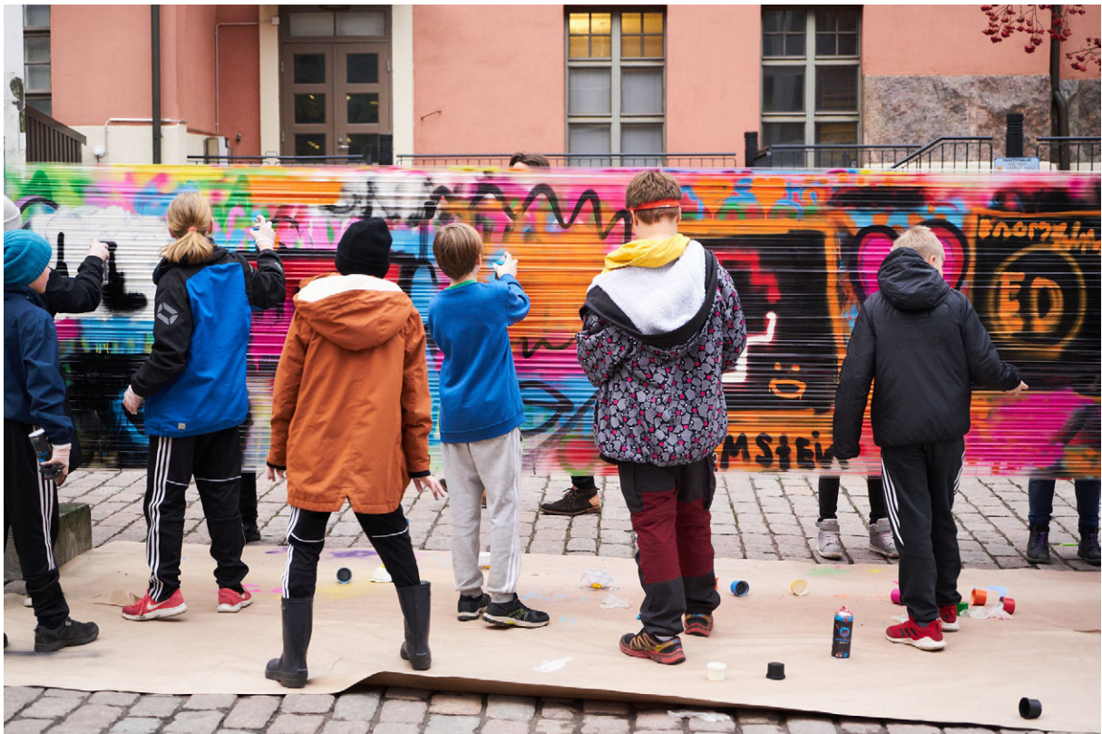
Graffitit ovat monelle nuorelle tärkeä tapa ilmaista itseään. Hiphop-kulttuuriin liittyvää ilmiötä voidaan pitää jo perinteenä.