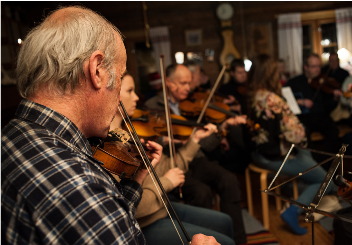
Kaustislainen viulunsoitto nimettiin Unescon ihmiskunnan aineettoman kulttuuriperinnön luetteloon vuonna 2021.