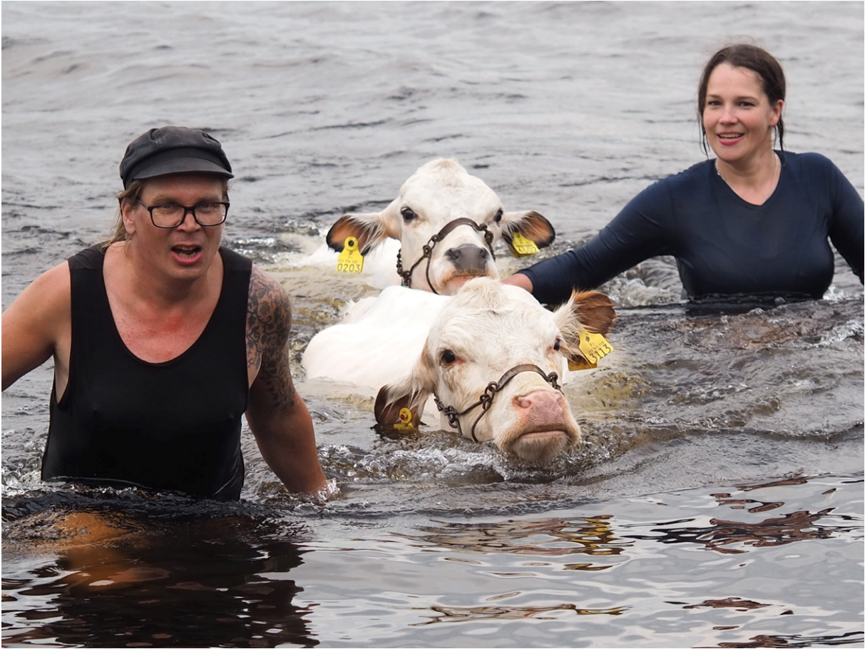
Suomenkarjan ja muiden kotieläinten hoitoon liittyviä monenlaista tietotaitoa.