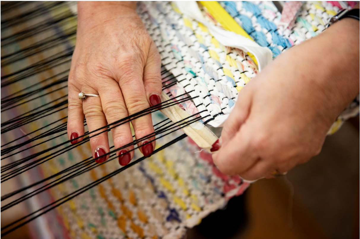
Räsymaton kudontaa Taitokeskuksessa Hyvinkäällä.