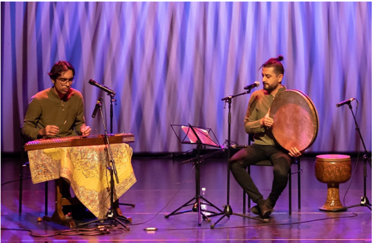
Iranilainen klassinen musiikki löytyy myös Elävän perinnön wikiluettelosta.