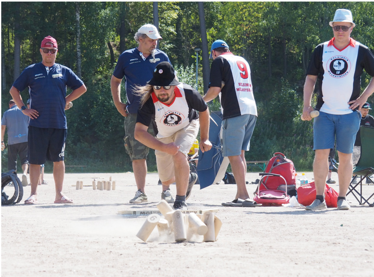
Mõlkin pelaaminen on noussut suureen suosioon viime vuosikymmeninä.