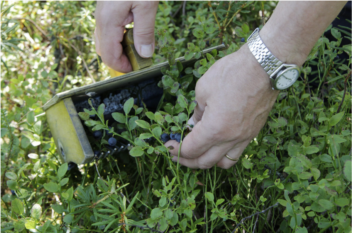
Jokamiehenoikeudet mahdollistavat marjastamisen kaikkialla Suomessa.