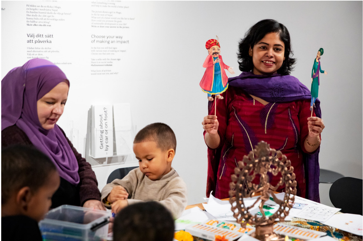
Satutyöpaja "Talvimatka Intiaan" Helinä Rautavaraan museossa Espoossa.