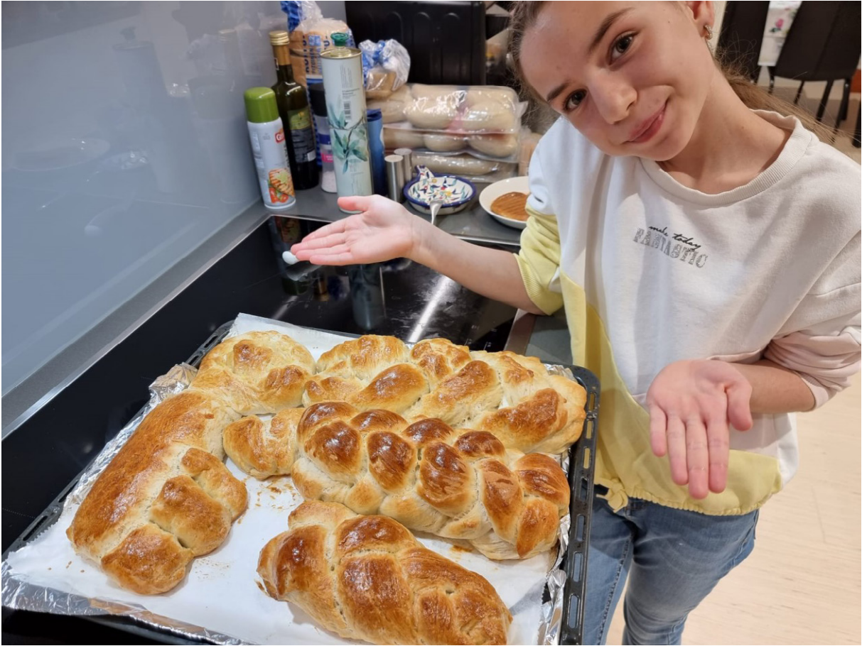
Challah-leipä on tärkeä perinneruoka juutalaisessa kulttuurissa.