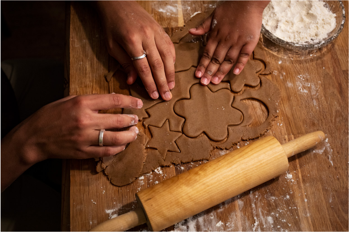
Piparkakkujen leipominen kuuluu jouluperinteeseen monessa maassa.