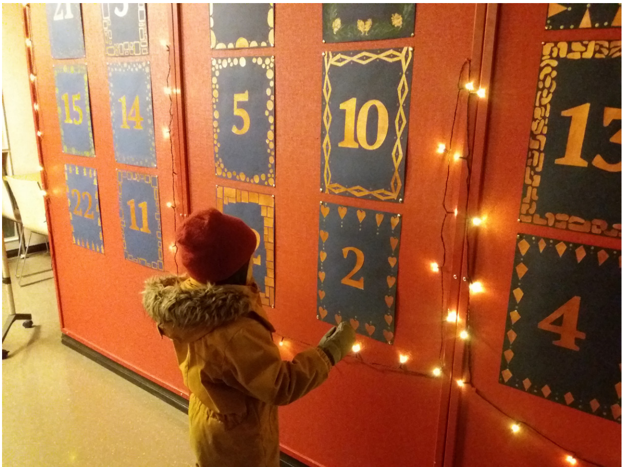
Käpylän elävä joulukalenteri.