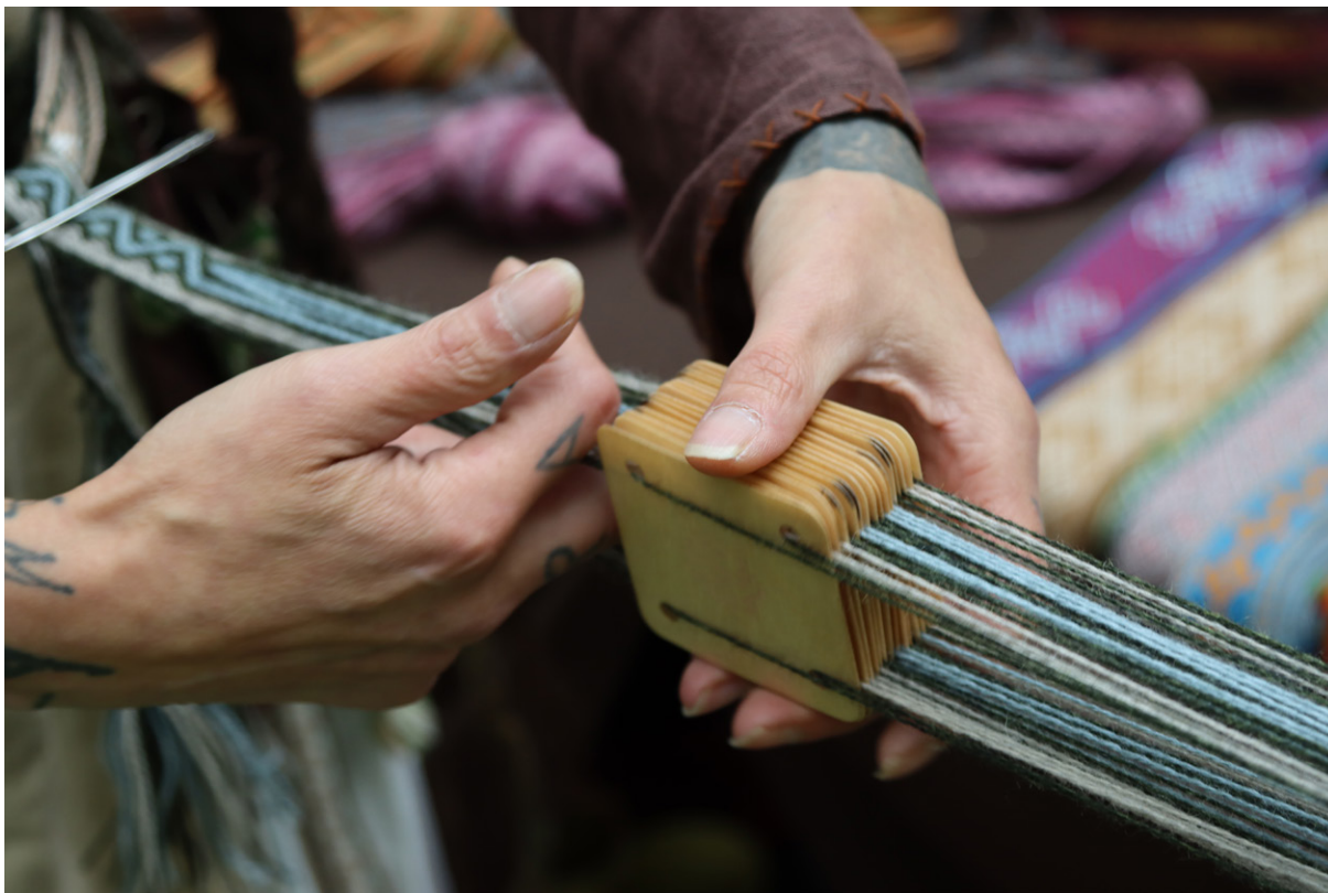
Nauhan punontaa Helsingan keskiaikapäivässä.