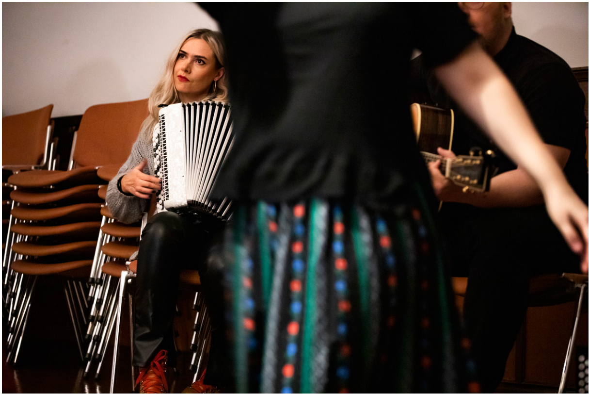
Kansantanssijameissa tanssitaan haitarin ja kitaran tahtiin Helsingissä.