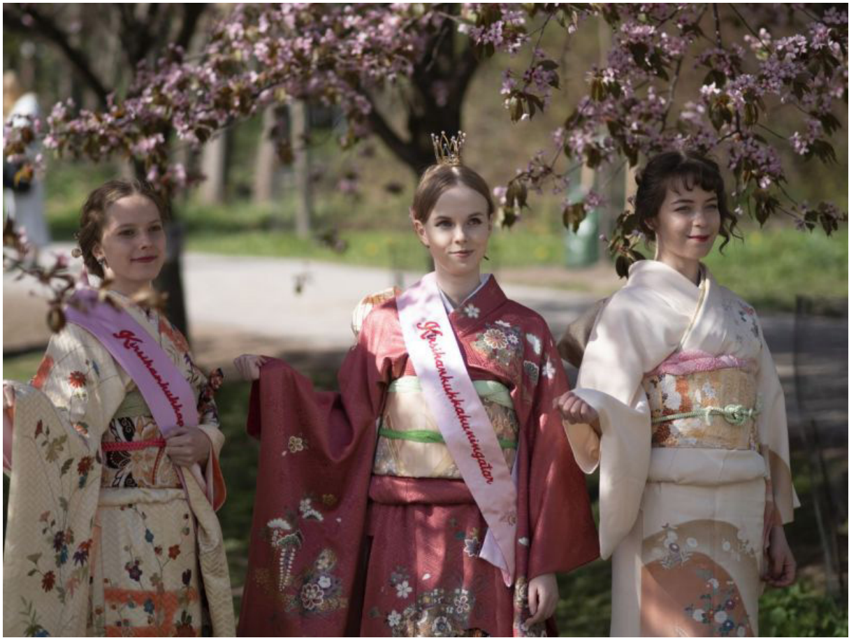
Japanilaista hanami-juhlaa vietetään Suomessakin kirsikkapuiden kukkiessa.